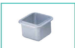
Bac d'étamage standard

Le revêtement spécial évite la corrosion du bac d'étamage, lui garantissant une longue durée de vie en service.