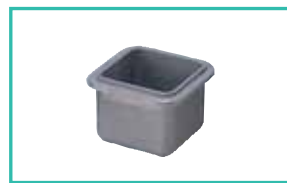
Bac d'étamage à revêtement spécial