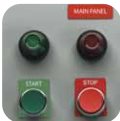
Bouton de commande