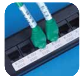
Baies de connexion