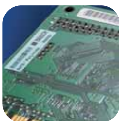
Identification de produits