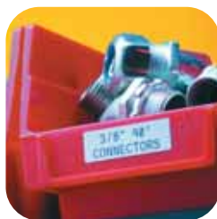
Étiquette de racks