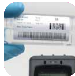
Identification laboratoire et santé