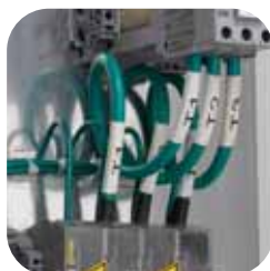
Manchons pour marquage de fils