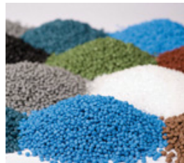
Industrie des plastiques