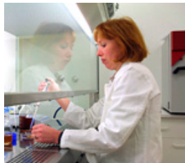
Recherche fondamentale / Instituts de recherche