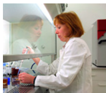
Recherche fondamentale / Instituts de recherche