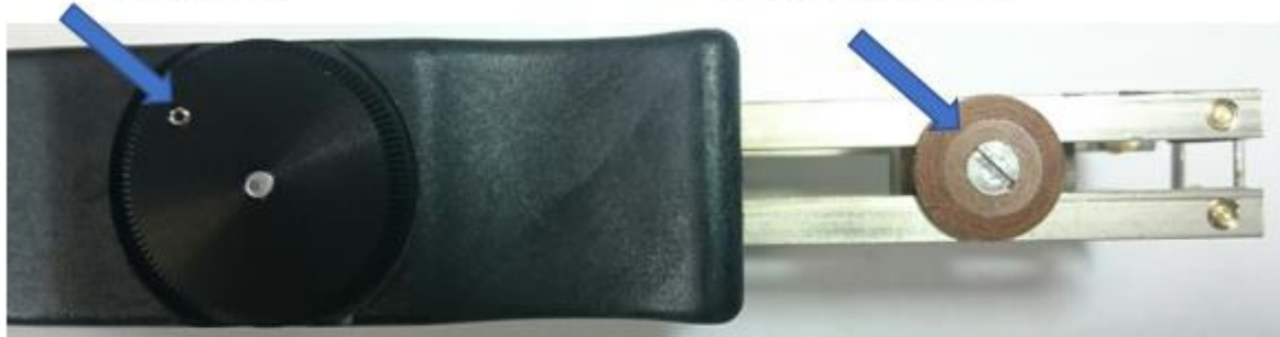
Vis de réglage longueur de dénudage