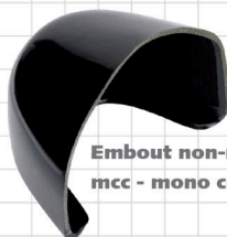
Embout non-métallique - mcc - mono coque cap