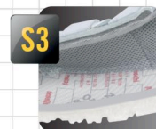
semelle antiperforation non-métallique