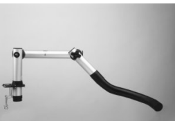
Extraction arm 3007/3407

Extraction arm 3015 incl. table bracket, one joint and 700 mm flexible hose. Extraction arm 3415, as 3015 but with air valve.