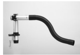
Extraction arm 3015/3415

Extraction arm 3046 incl. ball joint and 700 mm flexible hose. Extraction arm 3446, as 3046 but with air valve.