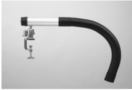
Extraction arm 3046/3446*

All arms can be ordered with a wall bracket, except for *