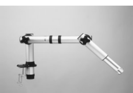
Extraction arm 3013/3413

Extraction arm 3017 incl. table bracket, two joints, horizontal link and 500 mm flexible hose. Extraction arm 3417, as 3017 but with air valve.